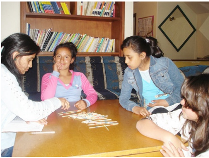
Unsere Kinder genießen die neuen Spiele.