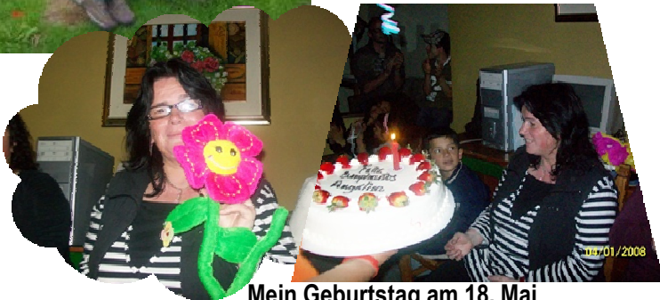
Mein Geburtstag am 18. Mai