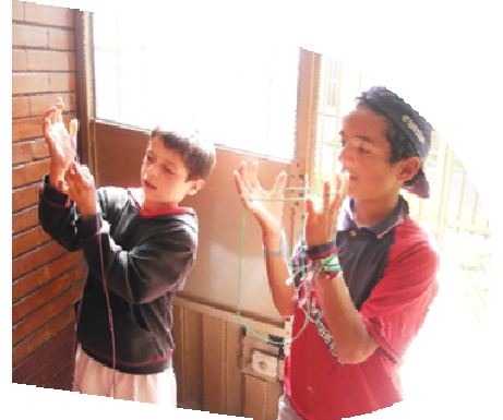
Wie alle Kinder wollen sie nur eins: spielen Schutz und geliebt werden