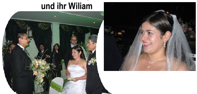
Danke an alle Paten die geholfen haben, daß die Beiden ein schönes Fest haben konnten.